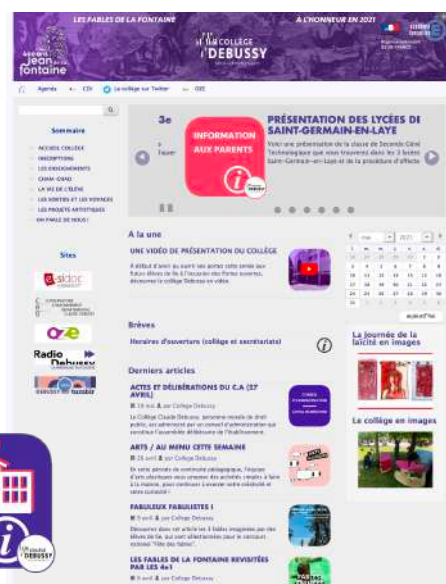
Capture d'écran de la page d'accueil du site web et exemple de vignette illustrant les articles.